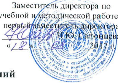
График соревнований на Кубок ректора Университета среди групп нового набора