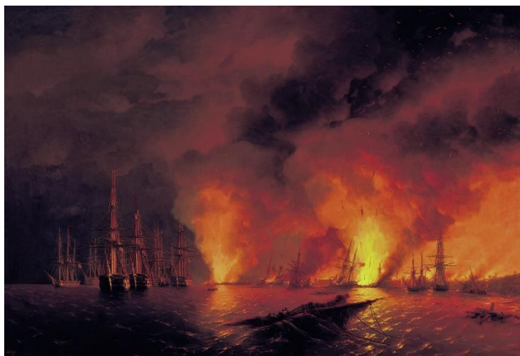
(И.К. Айвазовский «Синопский бой 18 ноября 1853 года (Ночь после боя)»)

Победой в Синопском сражении русский флот завоевал господство на Чёрном море и сорвал турецкие планы высадки десанта на Кавказе. В связи с поражением Турции её союзники — Великобритания и Франция в декабре 1853 г. ввели свои эскадры в Чёрное море.