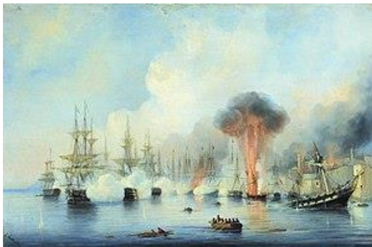
(А.П. Боголюбов Синопский бой 18 ноября 1853 г.)

(Николай I, надпись в именном рескрипте П. С. Нахимову)