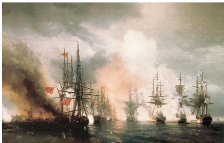
(И.К. Айвазовский «Синопский бой.1853 г.)

С прибытием подкреплений Нахимов, имея 6 линейных кораблей («Императрица Мария», «Париж», «Три святителя», «Великий князь Константин», «Ростислав» и «Чесма») и 2 фрегата («Кагул» и «Кулевчи»), решил атаковать турецкую эскадру, в составе которой было 7 быстроходных фрегатов, 3 корвета, 2 пароходофрегата, 2 брига и 2 военных транспорта. На стороне русских было преимущество в корабельной артиллерии (720 орудий против 510), на стороне турок — наличие паровых кораблей и береговых батарей (38 орудий).