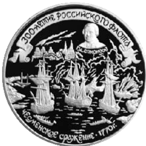
Монета в честь 300-летия российского флота с барельефом Г.А. Спиридова

многолетнюю безупречную службу и исключительные заслуги адмиралу оставили по день смерти «полное жалование его чина».