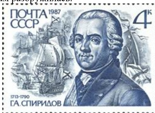
Портрет Г.А. Спиридова на марке Почты СССР. 1987 г.

В 1762 г. Спиридов, произведенный в контр-адмиралы, командовал эскадрой, отправленной в крейсерство к берегам Померании. Эскадра стала на рейде в Кольберге, откуда по два корабля поочередно отправлялись в плавание. Служба шла спокойно, ни захватывать чужие транспорты, ни охранять свои необходимости не было - военные действия уже прекратились. В августе 1762 г. эскадра в составе 7 кораблей вернулась в Ревель, вошла в гавань и там разоружилась.